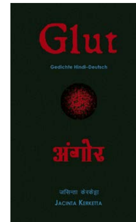
Draupadi Verlag, Heidelberg 2016, € 12,-