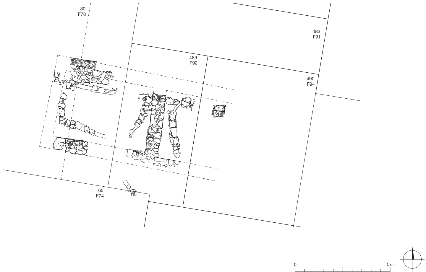
Abb. 3 Westquartier, Bereich der Sondage 480, spätarchaisches Gebäude, Steinplan 2013

henden archaischen Schichten 27 untersucht. Dabei fand sich beidseits der Innenmauer des spätarchaischen Baus ein mit Holzkohle, grösseren Ziegelfragmenten und rosabeigen lehmartigen Einschlüssen durchsetzter Zerstörungshorizont. Im östlichen Raum lag dieser direkt auf einigen flachen Steinplatten ( Taf. 13, 1 ), bei welchen es sich um ein Plattenpflaster 28 – den ursprünglichen Gehhorizont – handeln dürfte. Der diesjährige Befund lässt darauf schliessen, dass der Ostraum des spätarchaischen Baus nicht, wie 1996 angenommen, ein älteres und ein jüngeres Gehniveau 29 aufwies, sondern ein Plat-