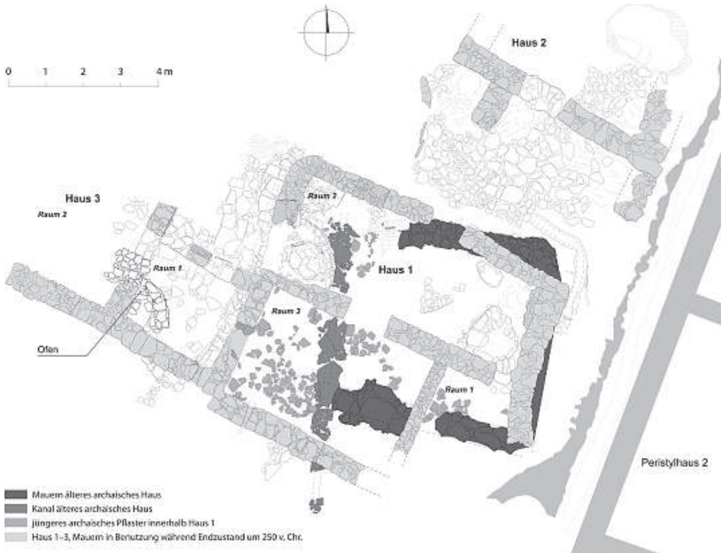
Abb. 4 Ältere Wohnbebauung westlich des Peristylhauses 2, schematischer Plan 2013

Schwierig ist die Beurteilung insbesondere wegen der im Jahr 2011 festgestellten Ausraubung der Mauerzüge im Anschlussbereich zwischen Haus 1 und 3. Mit dieser im späten 3. oder frühen 2. Jahrhundert v. Chr. erfolgten Wiederbenutzung der älteren Bauten steht möglicherweise ein im Berichtsjahr identifizierter Rest eines grösseren Ofens in Zusammenhang. Die mittelalterlich stark beeinträchtigte Konstruktion sitzt auf der Trennmauer zwischen Raum 1 und 2 von Haus 3. Erhalten hat sich ein Teil der Ofenrundung und eine im Norden daran anschliessende rechteckige Plattform 55 . Vielleicht gehört