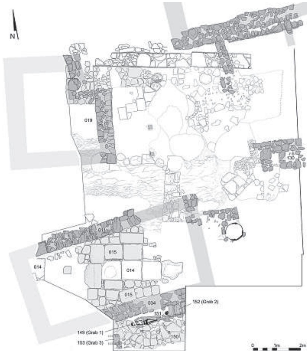
Abb. 2 Agora, Nordhalle, Schnitt EU10NW, 595 und 597, mittelalterliche Strukturen 2010/2011/2013

deckten Kleinfunde (unter anderem zwei italische Terra Sigillata-Randfragmente 9 ) lassen vermuten, dass diese Schliessung in der frühen Kaiserzeit erfolgte 10 . Durch den Druck des Geländes ist dieser sekundäre Mauerabschnitt in der Türöffnung leicht nach Süden ver-