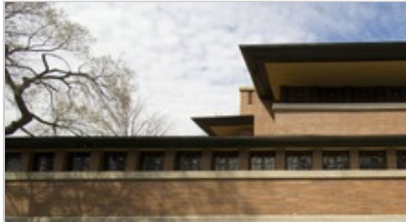
Zwei Ikonen der Architekturmoderne: Das Robie House von Frank Lloyd Wright ...