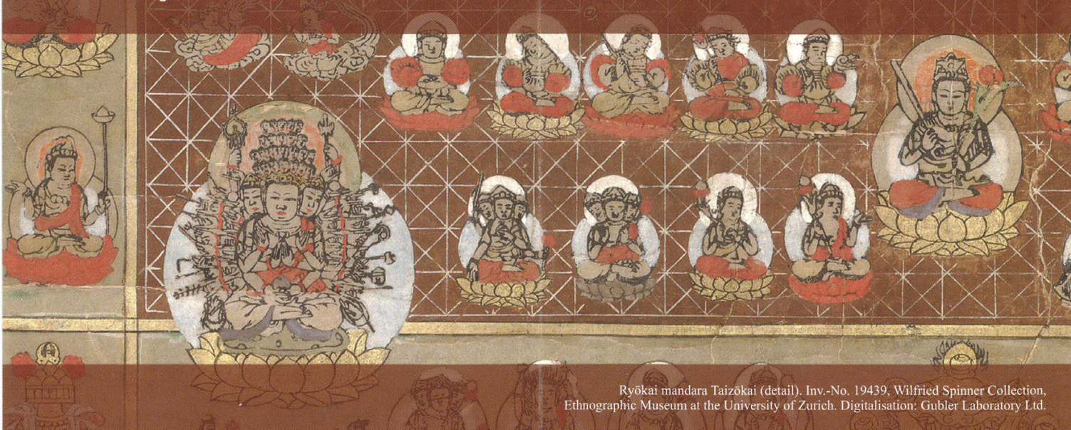
Ryōkai mandara Taizōkai (detail). Inv.-No. 19439, Wilfried Spinner Collection, Ethnographic Museum at the University of Zurich.