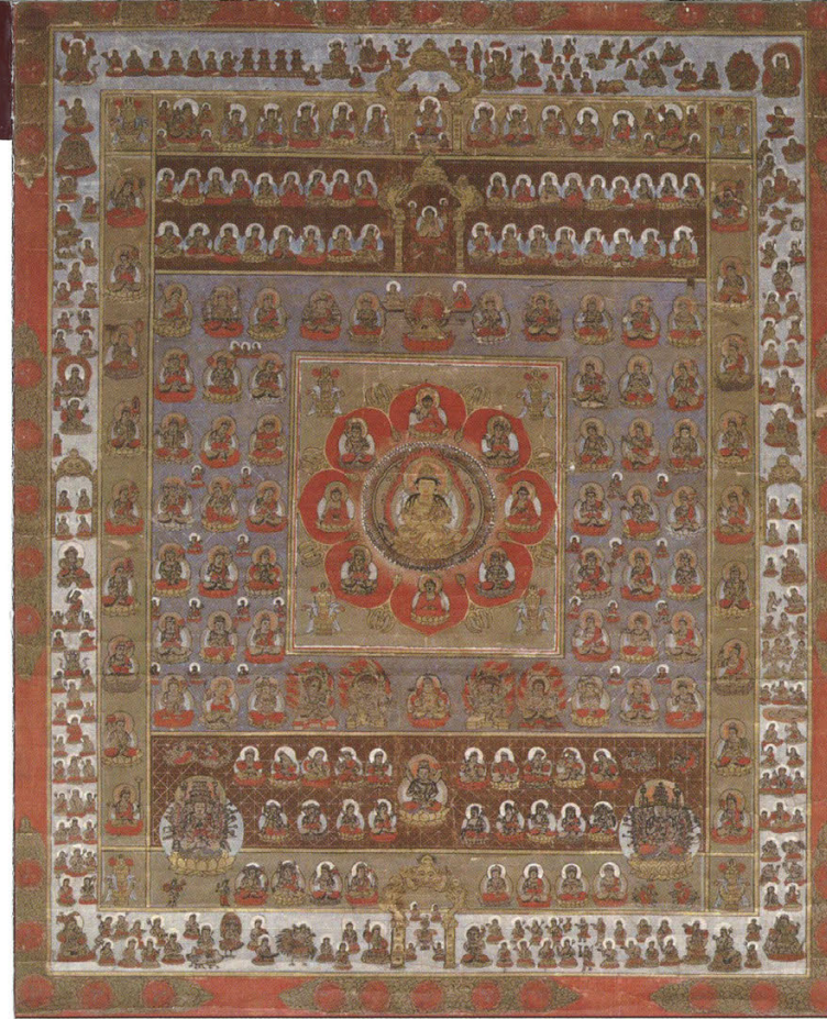
Ryōkai mandara Taizōkai. Inv.-No. 19439, Wilfried Spinner Collection, Ethnographic Museum at the University of Zurich.