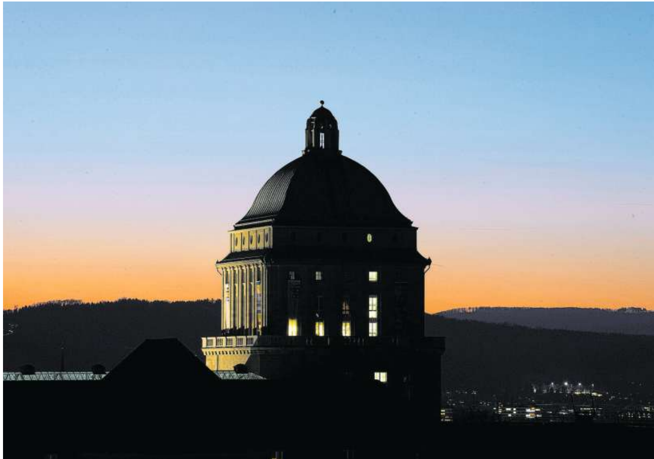
Nicht nur der Turm des Hauptgebäudes der Universität ragt heraus, sondern auch ihre Wirtschaftsfakultät.