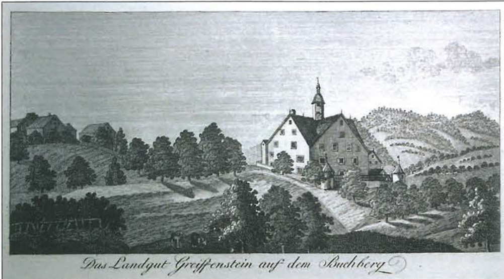
Das Landgut Greifenstein auf dem Buchberg

Das Privatarchiv Greifenstein wird im Stadtarchiv der Ortsbürgergemeinde St.Gallen aufbewahrt. Im Vergleich zu anderen Privatarchiven, die im Stadtarchiv aufbewahrt werden, nimmt dasjenige von Greifenstein rein räumlich betrachtet einen eher kleinen, seinen Inhalt betreffend hingegen einen wich-