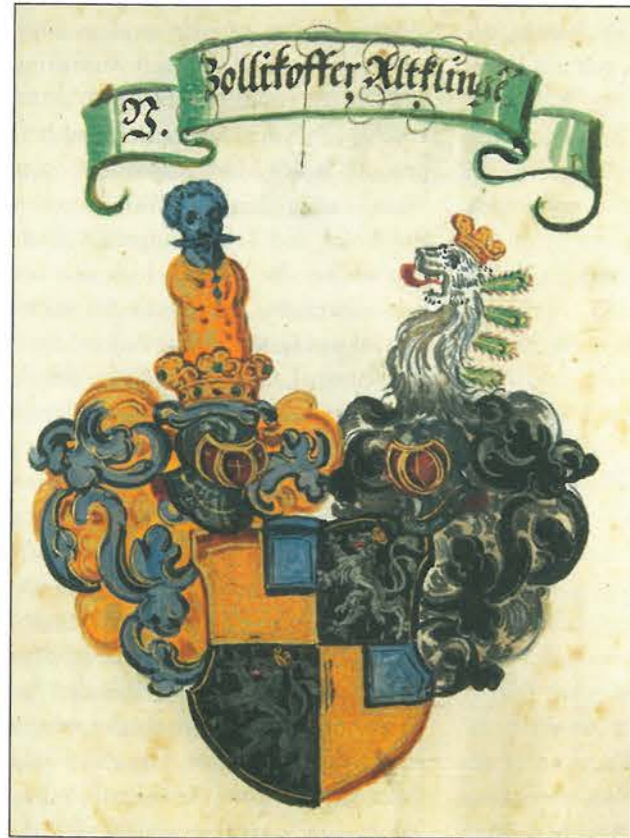
Wappen der Familie Zollikofer.

Wirtschaftliche Aspekte spielten auch eine Rolle. Im Falle von Greifenstein ist zu erkennen, dass die Landwirtschaft dem Eigentümer für seinen Bedarf an Getreide, Obst, Fleisch, Wein, Most, Milch und Holz diente. Aufgrund fehlender Mengenangaben, die eine Quantifizierung zulassen würden, kann nicht festgestellt werden, in welchem