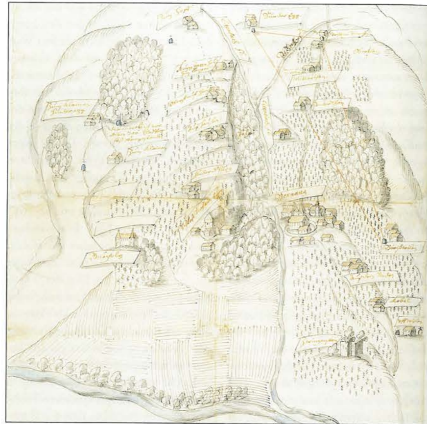
Ansicht von Berneck, 17. Jahrhundert, Stiftsarchiv St. Gallen.