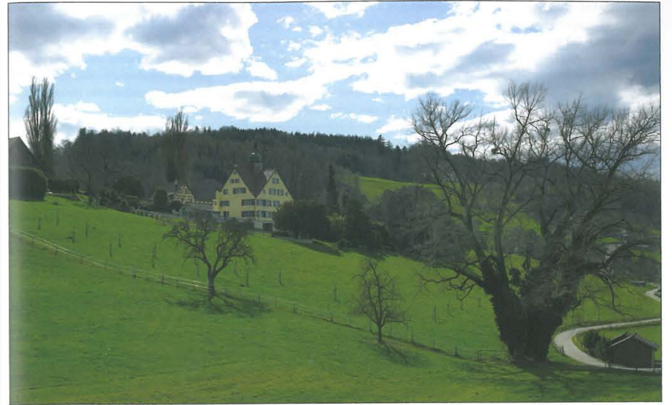
Schloss Greifenstein, Foto 2010.

gen und burger zu st. Gallen den erberen Crista Dobler uff dem Buchberg im gricht und hoff zu Thall im Rinthall von wägen des gantzen gutzs seines hoffs uff dem Buchberg, Grieffenstain genambtt, sampt