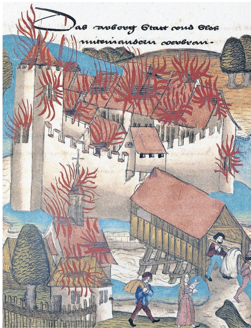
Von den drei grossen mittelalterlichen St. Galler Stadtbränden sind keine Abbildungen überliefert. Stellvertretend zwei Illustrationen aus Chroniken von Diebold Schilling: Links der Berner Stadtbrand von 1405 aus der Spiezler Bilder-Chronik (1485), rechts der Brand der Stadt Aarberg am 3. Mai 1477 aus der grossen Burgunder-Chronik (um 1500).