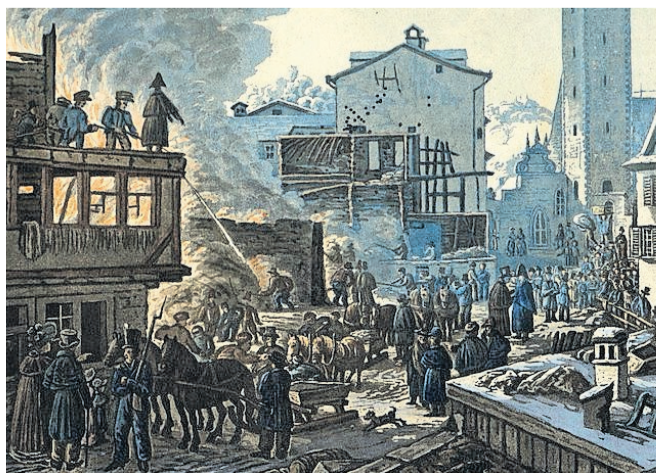
Bild: Kantonsbibliothek Vadana St. Gallen Der Brand zu St. Mangen im Januar 1830 von Johann Baptist Isenring.