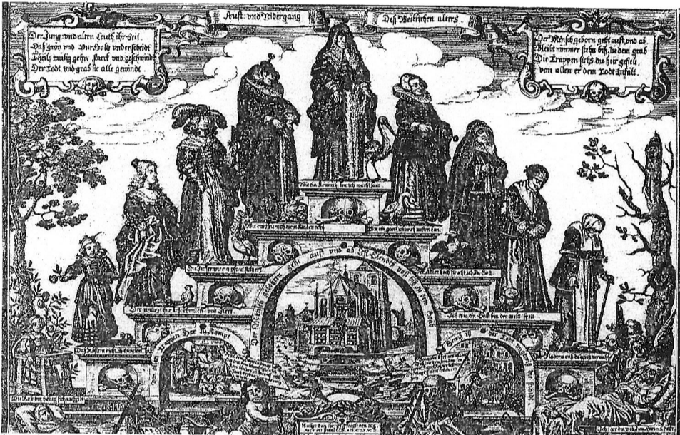
Die Lebensstreppe: Diese Darstellungen erfreuten sich im 16. und 17. Jahrhundert grosser Beliebtheit.