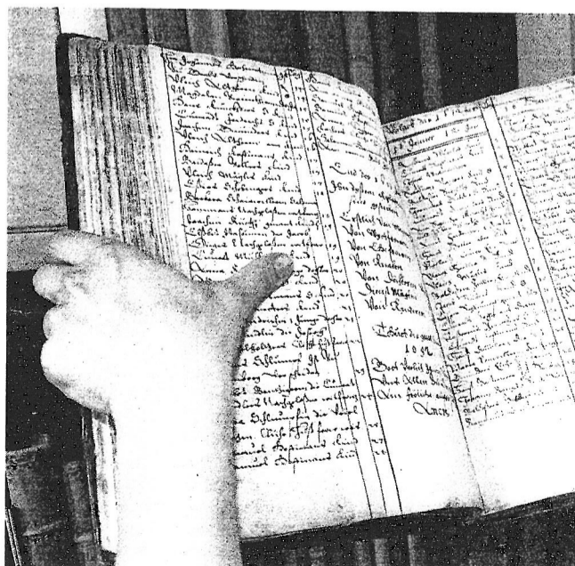
Das Totenbuch der Stadt St. Gallen wird im Stadtarchiv aufbewahrt.

Stadtarchiv St. Gallen, Totenbuch, Seiten 136 und 140