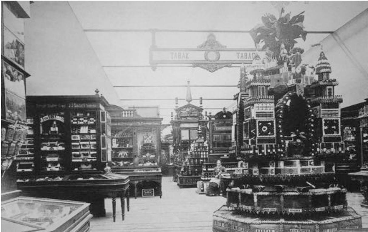
Abb. 1: Ein wichtiges Element der ersten Landesausstellung waren Präsentation und Verkauf. Zugelassen waren nur schweizerische Produkte.

Notwendigkeit von wirtschaftlichen und politischen Reformen hinzuweisen. Eine solche Neuerung war die gerade angesichts einer Landesausstellung wichtige Einführung eines Patentschutzgesetzes: Die Angst vor Nachahmung hatte nämlich zahlreiche potenzielle Aussteller an einer Teilnahme gehindert. 3 Weiter sollten mit der Landesausstellung Handel und Wirtschaft gefördert werden. 4