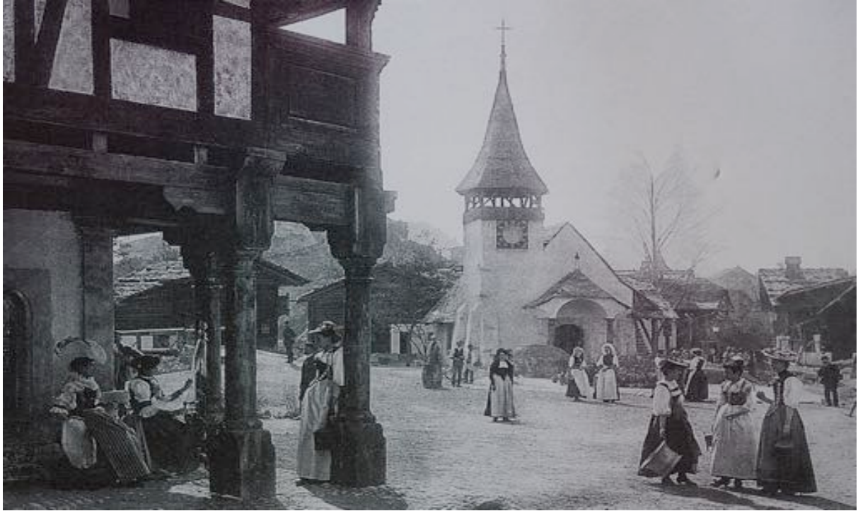
Abb. 2: Das „Village Suisse“ bestand aus Holzhäusern und Oberländer Chalets, die einen Platz mit einer Kirche säumten.

Nebst dem „Village Suisse“ gab es auch ein „Village noir“: Ein Genfer Geschäftsmann liess 230 Sudanesen in die Schweiz holen, die während der gesamten Ausstellung in Lehmhütten hausen mussten. Die Idee des „Village Suisse“ und des „Village noir“ war keine ursprünglich schweizerische: Ähnliches war bereits an früheren Weltausstellungen zu besichtigen gewesen.