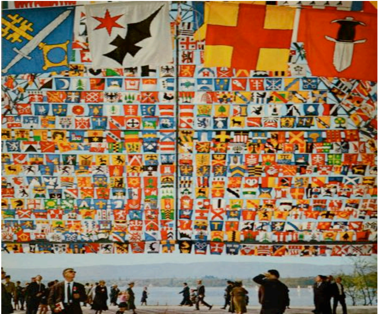
Abb. 8: Die Fahnen der 3000 Schweizer Gemeinden schmückten in Lausanne den „Weg der Schweiz“.

Generell betrachtet stand die Expo 64 im Zeichen der Hochkonjunktur und war dementsprechend von Fortschrittsglaube und Hoffnung geprägt. Dennoch schwang die Angst vor einer materialistischen Haltung der Bevölkerung mit, die sich politisch gleichgültig verhalte und kein Interesse an gesellschaftlichen Fragen zeige. 30 Die Veranstalter setzten sich deshalb zum Ziel, einen Ansporn zur schöpferischen Tätigkeit zu liefern und die Rückbesinnung auf traditionelle Werte in der Bevölkerung zu lancieren. 31 Kritik erntete die Expo 64 dafür, dass sie aufgrund ihrer weitgehenden Konservierung keine neuen Visionen entstehen liess. 32