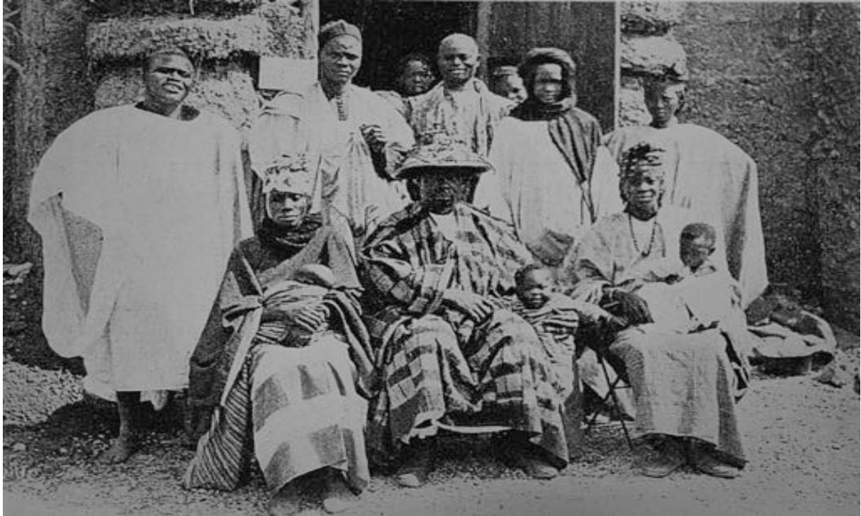
Abb. 3: Nebst dem „Village Suisse“ gab es für das Publikum auch ein „Village noir“ zu bestaunen. Im kühlen, regnerischen Sommer 1896 froren 230 Sudanesischen und Sudanesen.

Die Ausstellung in Genf stand weiter im Zeichen eines gleichzeitig herrschenden zollpolitischen Konfliktes mit Frankreich. Sie eignete sich deshalb für die Propagierung des wirtschaftsnationalistischer Ziele: Politiker nutzten denn auch die Gelegenheit, das Publikum zum Kauf von Schweizer Produkten zu ermahnen. 11