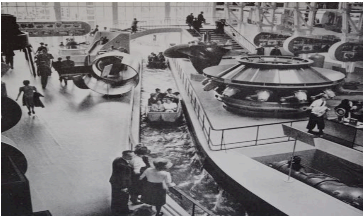
Abb. 6: Das Landidörfli, die Seilbahn und der Schifflibach (im Bild) ermöglichten dem Publikum unbeschwerte Tage an der Landi 1939 – der zweiten Landesausstellung, während der ein Krieg ausbrach.

Die Ausstellung bot den Besucherinnen und Besuchern auch 1939 Zerstreuung und Vergnügen. Ein „Dörfli“ war ebenfalls fester Bestandteil der Landesausstellung. Es befand sich am anderen Ufer des Zürichhorns und war vom Rest der Ausstellung über eine Gondel oder ein Schiff zu erreichen. Dank der Restaurants und weil es mit den Ostschweizer Riegelhäusern Heimatgefühle weckte, war es ein bevorzugter Aufenthaltsort. 20 Daneben konnte sich das Publikum auf dem Schifflibach in kleinen Booten durch das Ausstellungsgelände treiben lassen.