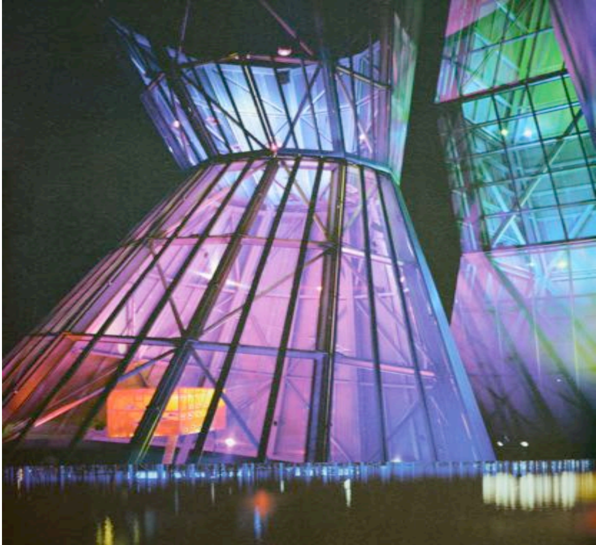
Abb. 10: Die Architektur war ein wichtiger Bestandteil der Expo.02. Die Türme auf der Artepflage Biel waren nachts Licht- und Klangskulpturen.

Die Expo.02 wurde aber wegen der organisatorischen Mängel, dem Scheitern des unrealistischen Sponsoring-Konzepts und den daraus folgenden massiven Kreditüberschreitungen auch heftig kritisiert. Auch die mangelnde Nachhaltigkeit der positiv aufgenommenen Infrastruktur wurde den Organisatoren vorgeworfen.