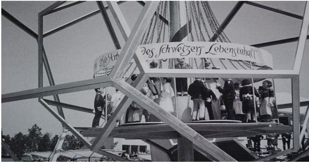
Abb. 7: Die „Gulliver“-Befragung hatte im Vorfeld der Expo 64 zu Kritik geführt. Die vom Bundesrat als heikel eingestuften Fragen durften nicht mehr gestellt werden.

Im Vorfeld der geplanten Ausstellung hatte sich auch Max Frisch gemeinsam mit zwei anderen namhaften Persönlichkeiten konzeptionell zu Wort gemeldet: Anstelle einer gewöhnlichen Ausstellung sollte eine Musterstadt errichtet werden; damit sollte die Landesausstellung einer Regionalentwicklung von Nutzen sein. Diese Idee wurde jedoch nicht umgesetzt, deshalb öffnete 1964 in Lausanne eine herkömmliche Ausstellung ihre Tore und lockte über 10 Millionen Besucherinnen und Besucher an den Genfersee. 27