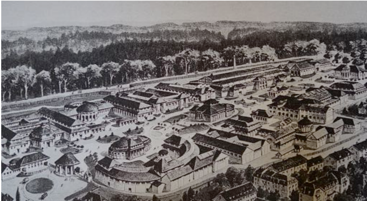
Abb. 4: Die Architektur an der Landesausstellung 1914 erinnerte die Romands an den Münchner Baustil. Sie stiess bei ihnen darauf auf Ablehnung.

Die Romands schwärmten jedoch noch immer von ihrem „Village Suisse“ von 1896 und waren der Meinung, dass die Bauweise an der Berner Landesausstellung an den Münchner Stil angelehnt war.