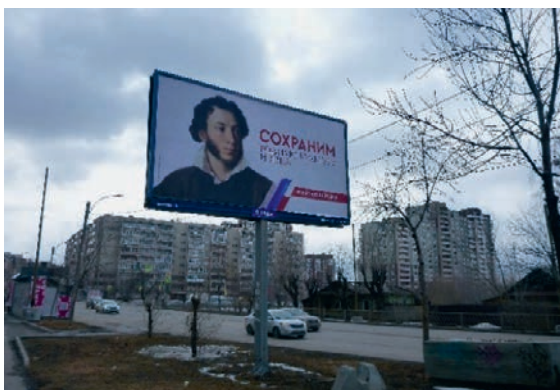
Werbung für die Verfassungsreform in Jekaterinburg: "Wir schützen die heimatische Kultur und Sprache", März 2020

Trotz massiver Menschenrechtsverstöße und einem in der Praxis fast allmächtigen Präsidenten hatte Russland bisher an seiner liberalen Verfassung aus dem Jahr 1993 festgehalten, die – gewissermaßen als Gegenentwurf zum sowjetischen System – Gewaltenteilung, Rechtsstaatlichkeit, Demokratie, Pluralismus und die Freiheit des Einzelnen als höchstes Gut garantierte. Insofern überraschte es, als Präsident Putin im Januar 2020 eine Verfassungsreform ankündigte. War die Verfassung nicht ohnehin nur bloße Fassade?