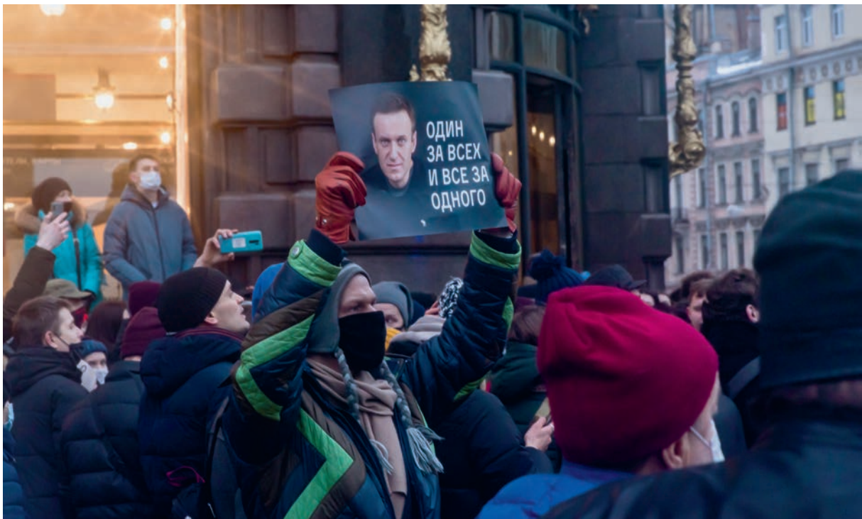
"Einer für alle, alle für einen": Proteste für die Freilassung Alexej Navalnys im Januar 2021 in St. Petersburg