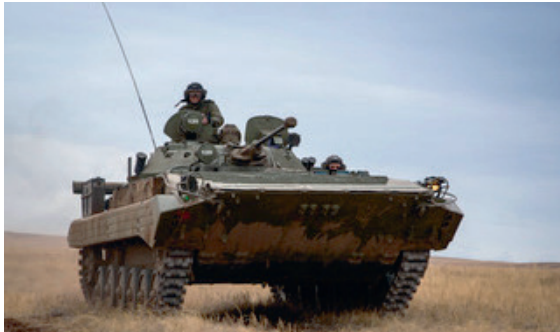
BMP-2 der russischen Streitkräfte