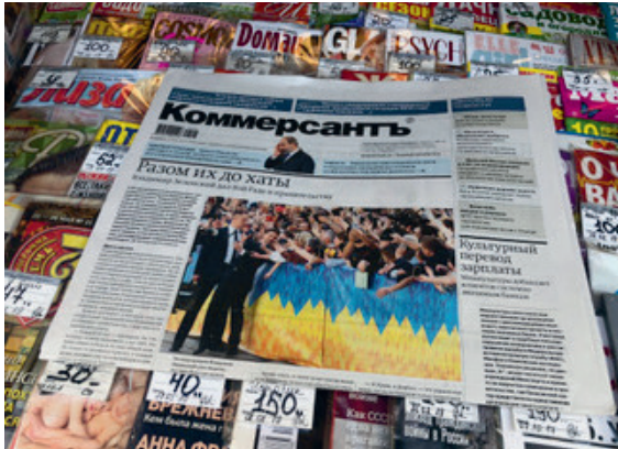
Kiosk in Moskau

Um die Pressefreiheit ist es in Russland seit längerem schlecht bestellt: die grossen Fernsehsender stehen unter staatlicher Kontrolle, die meisten Zeitungen auch, krenlkritische Journalisten müssen mit Repressalien rechnen. Dennoch gibt es immer noch spannende, kritische Medien - vor allem online. Doch nun geraten auch diese letzten Inseln der freien Diskussion ins Visier des Staates.