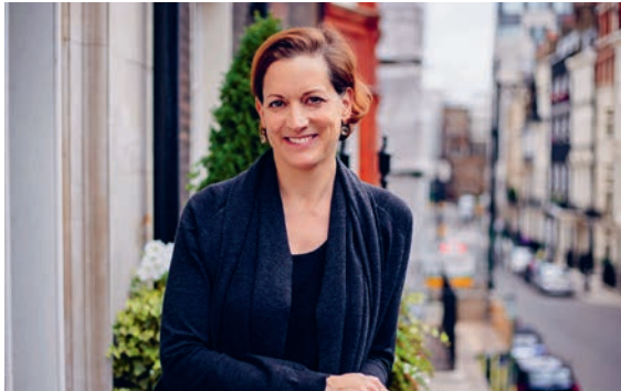
Anne Applebaum

Das ist der Titel des nun auch auf Deutsch übersetzten Buches « Twilight of Democracy. The Seductive Lure of Authoritarianism » von Anne Applebaum, langjährige Kolumnistin der Washington Post und jetzige Mitarbeiterin bei « The Atlantic ». Anne Applebaum hatte sich bereits einen Namen gemacht als Autorin von drei Büchern über die Geschichte der Sowjetunion und dafür den Pulitzer Preis gewonnen.