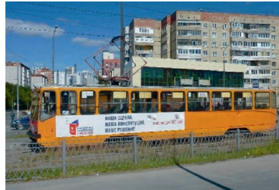
Strassenbahn mit Werbung für die Verfassungsreform in Jekaterinburg, Juni 2020: Betonung des "Wir"

Doch wirklich „neu“ waren die Änderungen letztlich nicht: Vielmehr wurde der Verfassungstext in weiten Teilen nur an die Verfassungswirklichkeit angepasst.