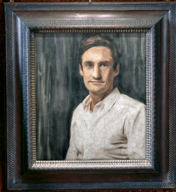
Schweizer Selfmade-Milliardär: Guillaume Pousaz, Gründer des Fintech-Start-ups Checkout.com

FOTOS: MICHAEL BÜHOLZER, GETTYIMAGES | INFOGRAFIK: BEOBSACHTER/AM | QUELLE: STUDIE «INSIGHTS FROM SWISS RICH LIST™, ETH/UNIVERSITÄT ST. GALLEN VON FEBRUAR 2023, BASIEREND AUF DEN REICHESTENLISTEN VON «BILANZ» (SCHWEIZ) UND «FORBES» (USA)