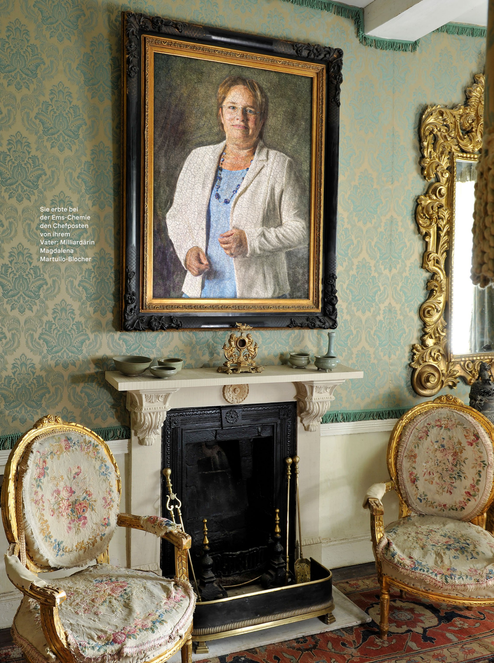
Sie erbte bei der Ems-Chemie den Chefposten von ihrem Vater: Milliardärin Magdalena Martullo-Blocher