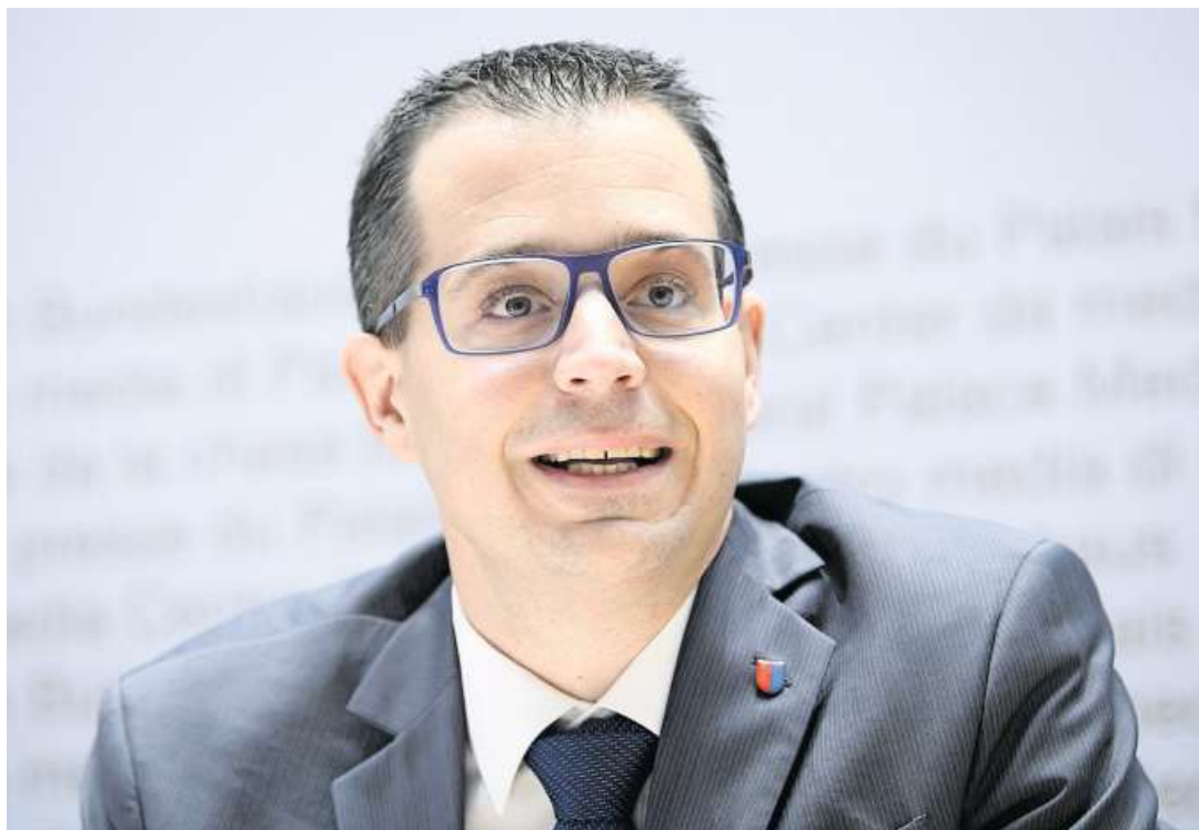
Nationalrat Marco Romano (Mitte/TI) empfiehlt der Deutschschweiz längere Ferien.

CH Media erreicht den Tessiner Mitte-Nationalrat Marco Romano auf dem Weg an eine Sitzung auf seiner Fernsprech-