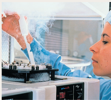
Rasches Abkühlen verhindert Schäden.

Die Kryo-Konservierung von Eizellen wurde ursprünglich für Krebspatientinnen entwickelt, die durch eine Chemo- oder Strahlentherapie häufig unfruchtbar werden. Indem ihnen vorsorglich Eizellen entnommen und auf -196^{\circ}\text{C} hinuntergekühlt werden, können sie zu einem späteren Zeitpunkt auf diese Eizellen zurückgreifen und sie für eine In-vitro-Befruchtung verwenden.