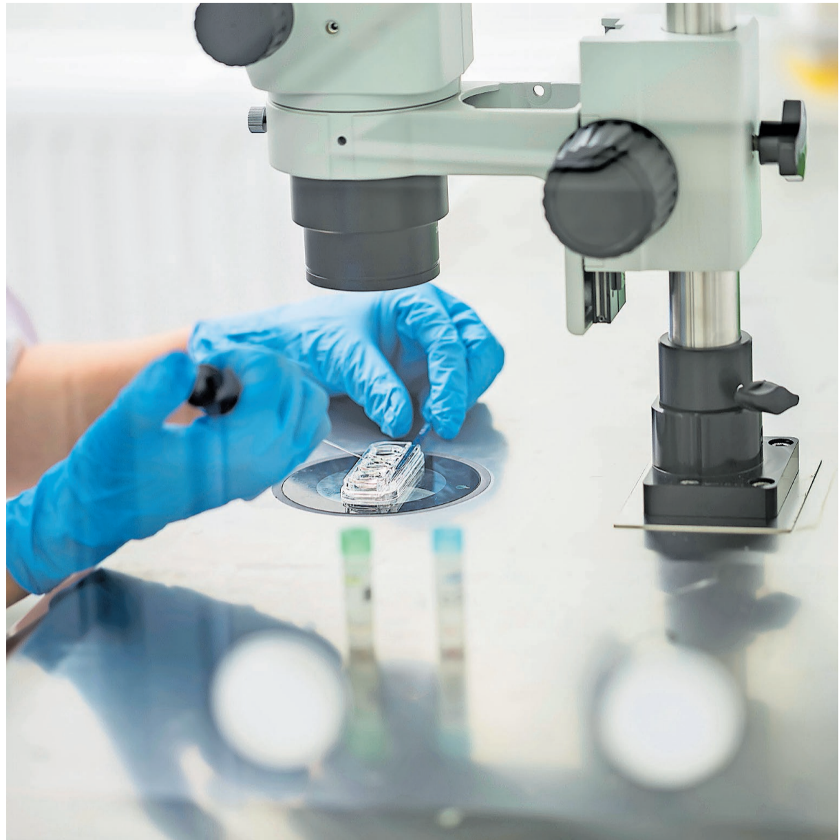
Die eingefrorenen Eizellen können aufgetaut und für eine In-vitro-Befruchtung verwendet werden.

Die Brüsseler Studie lieferte einen weiteren wichtigen Befund: Von den Frauen, die ihre Eizellen auftauten, wurde nur ein Drittel schwanger. Mit anderen Worten: Das «Social