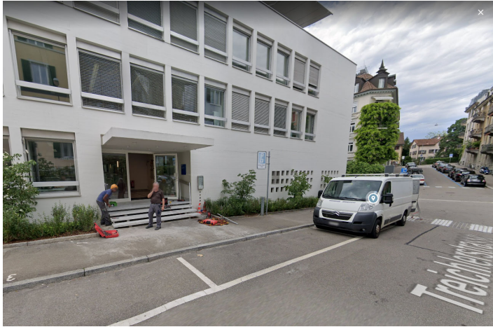
Treichlerstrasse 10, ZH