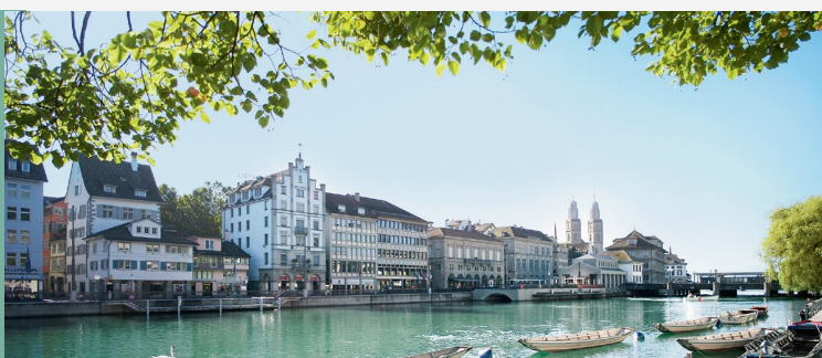
Sicht von der Schipfe auf das Limmatquai in Zürich View from the Schipfe at the Limmatquai in Zurich