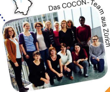
Das COCON-Team aus Zürich