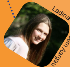
Ladina aus dem Aargau