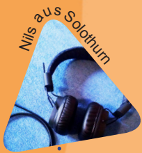
Nils aus Solothurn