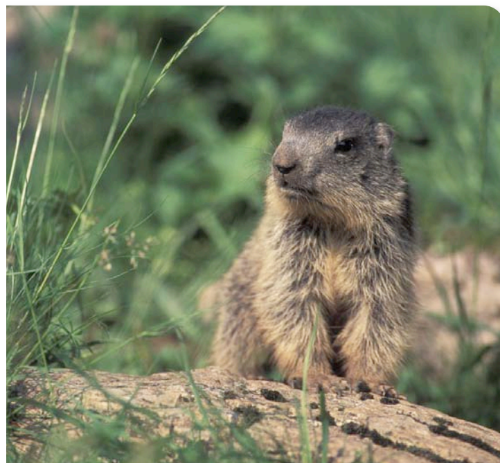
Las marmotas observan el paso de los senderistas. Su único temor es la presencia de alimañas.