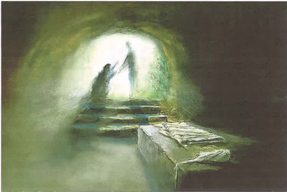
James Martin, Resurrection Morning . © RR

De Zwitserse theoloog Simon Peng-Keller bestempelt visionaire ervaringen in de nabijheid van de dood als " palliative Imagination ". Hij kiest bewust voor een zo neutraal mogelijke term om niet geklemd te raken tussen de uiterst uiteenlopende verklaringsmodellen ervoor. Belangrijk voor de hoogleraar Spiritual Care aan de universiteit van Zürich is dat zorgverleners ruimte creëren voor het genezende en troostende potentieel ervan.