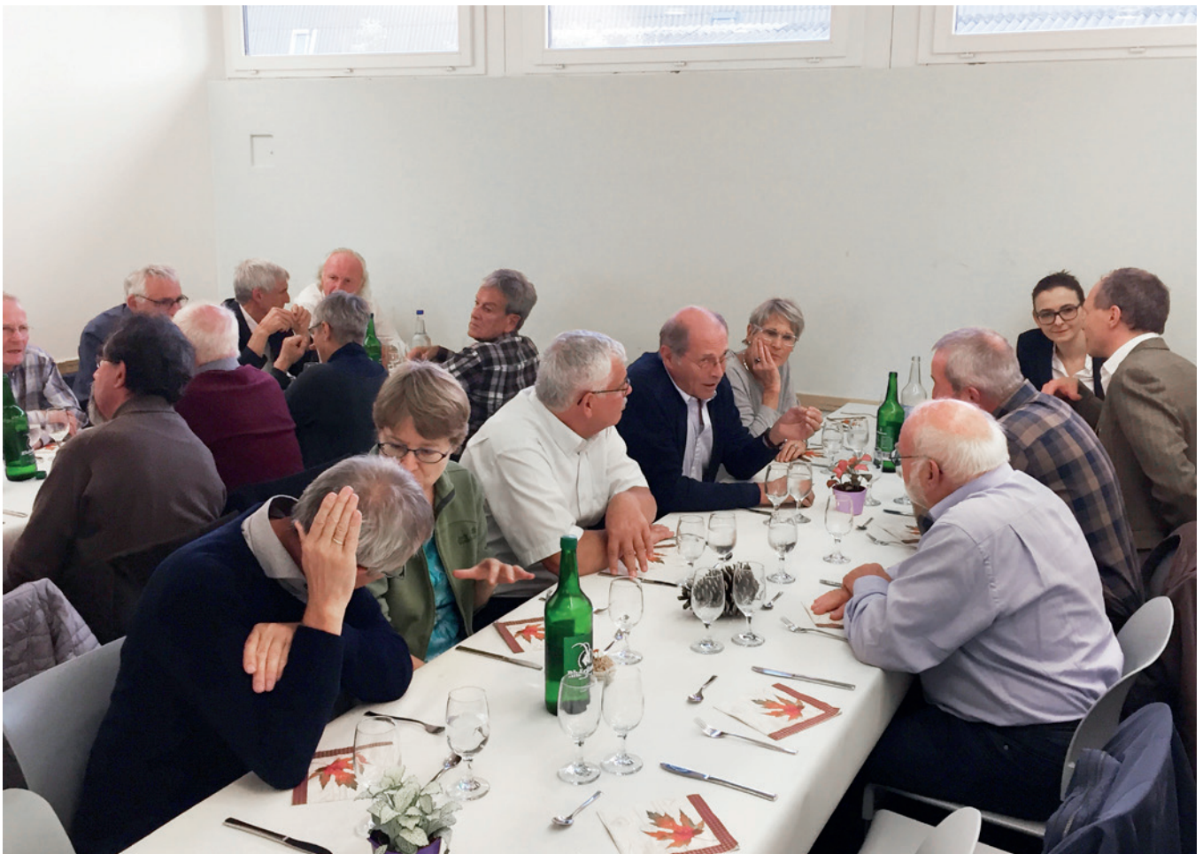
Das gemeinsame Abendessen in der Mensa des Tierspitals als gemütlicher Ausklang einer überaus gelungenen Tagung

das Kältezittern zu verlieren. Wir waren beeindruckt, wie gut sich die Alumni-Organisation um den Nachwuchs kümmert und freuen uns, durch unsere Mitgliedschaft künftig auch einen kleinen Teil dazu beitragen zu können.