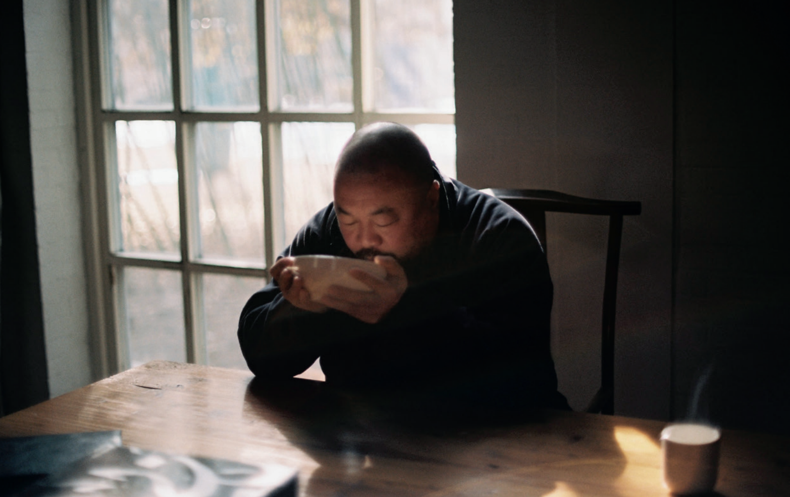
Ai Wei Wei, Beijing, 2014 © Simon Schwyzer