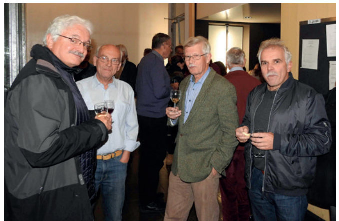
Alumni nach der Generalversammlung

Motto: «Man kann den Gaul zum Brunnen führen, aber saufen muss er selbst!»