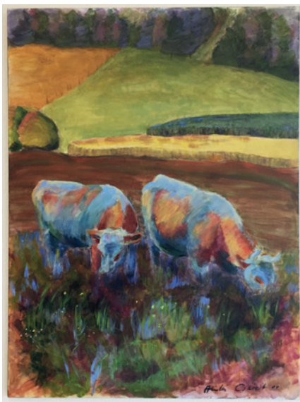
Eines der vielen, ausdrucksstarken Bilder von Anita Geret

zur vielseitigen und sehr gelungenen Alumni-Tagung vom 14. September 2017 schildern.