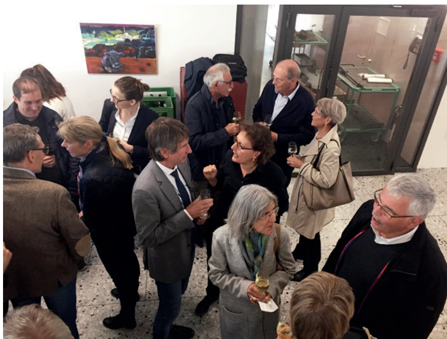
Der Apéro bot Gelegenheit zu interessanten Gesprächen mit Berufskolleginnen und -kollegen

Zusätzlich zu unserem Bericht über die Alumni-Tagung 2017 möchten wir zum Schluss im Besonderen auf die Projektförderung durch die