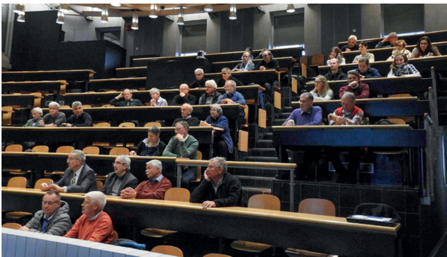
Die Alumni vor der GV

Es ist aber auch festzuhalten, dass die Erstellung eines Netzwerkes nicht von selbst geschieht! Es braucht viel Arbeit, um zuerst eine Netzwerkplattform zu entwickeln, auf welcher das eigentliche Netzwerk durch die Mitglieder und die Studierenden selbst erstellt werden kann. Sie lesen daraus, dass die Alumnivereinigung gerne bereit ist, einen Kontaktrahmen zu gestalten, dass Sie als Mitglied oder als Studierende jedoch die Freiheit haben, die Gelegenheit beim Schopf zu packen, Ihre Zielpersonen anzusprechen und ein eigenes Netzwerk auf der Netzwerkplattform der Alumni zu erstellen; ganz nach dem Veterinär-