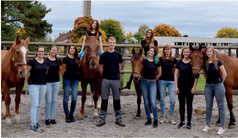
Fachschaft Vetsuisse Bern

dierenden. Die Wochenend- und Nachtdienste sind viel weniger lang und nach einer gewissen Anzahl Arbeitsstunden steht es den Studierenden frei, nach Hause zu gehen und am nächsten Tag vom Klinikdienst freigestellt zu sein. Die Fachschaft hat hier an den Vermittlungsgesprächen zwischen Fakultät und Studenten massgeblich mitgewirkt.