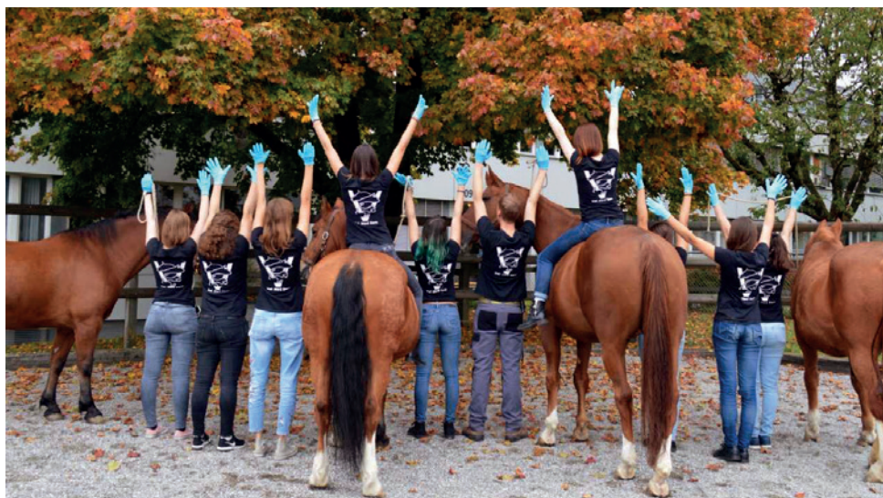
Fachschaft Vetsuisse Bern

Auf der Website www.fachschaft-vetmedbern.ch finden sich die die Terminkalender, eine Vorstellung der Vorstandsmitglieder und noch viel mehr Informationen über die Fachschaft und ihre Aktivitäten.