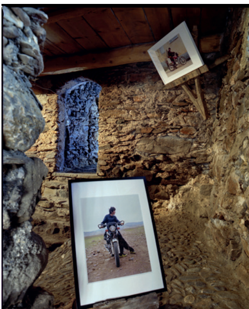
Poryecto Amil, Tschlin, 2017

***Ai Weiwei ist der wohl bekannteste Künstler der Welt. Seine Karriere hat er allerdings in der Schweiz begonnen, mit einer kleinen Einzelausstellung 2004. Nun ist Ai Weiwei wieder in der Schweiz zu Gast mit einer grossen Ausstellung in Lausanne, die viel über seine Arbeitsweise verrät. (SRF Kultur Sonntag, 24. Sep 2017)