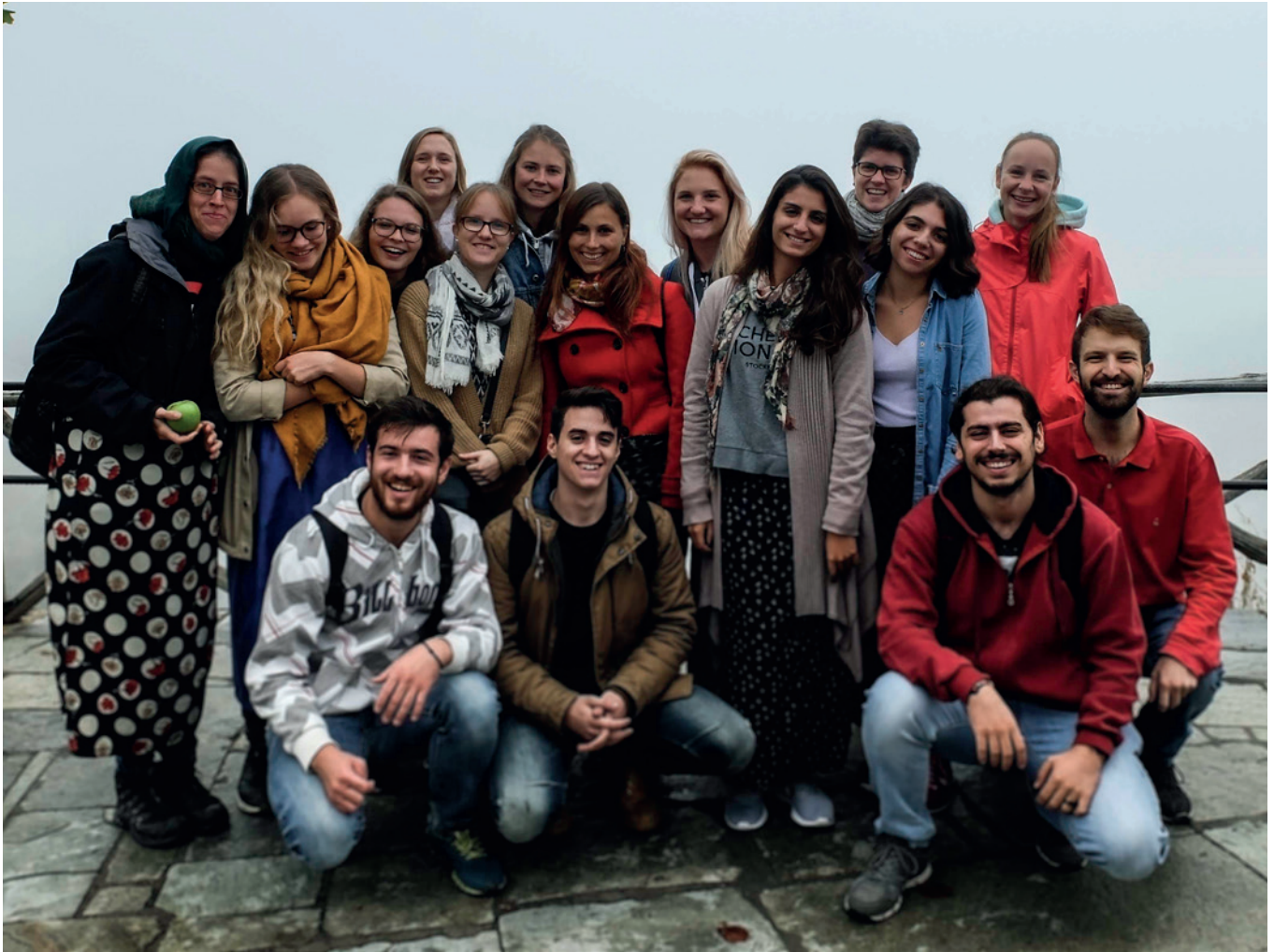
IVSA Zürich mit IVSA Thessaly in der Meteora, Griechenland

– schon um 6 Uhr ging es mit dem Zug los nach Meteora. Dies ist eine Versammlung von wunderschönen Klöstern, die auf hohen Sandsteinfelsen gebaut wurden. Dabei konnten wir trotz bewölktem Himmel eine wundervolle mystische Aussicht bewundern. Der Abend klang wieder in munterer Stimmung in einer Bar aus.