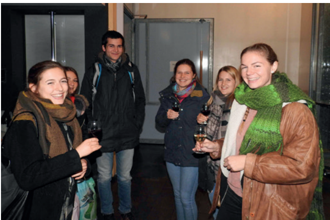
Studierende am Alumni-Apéro