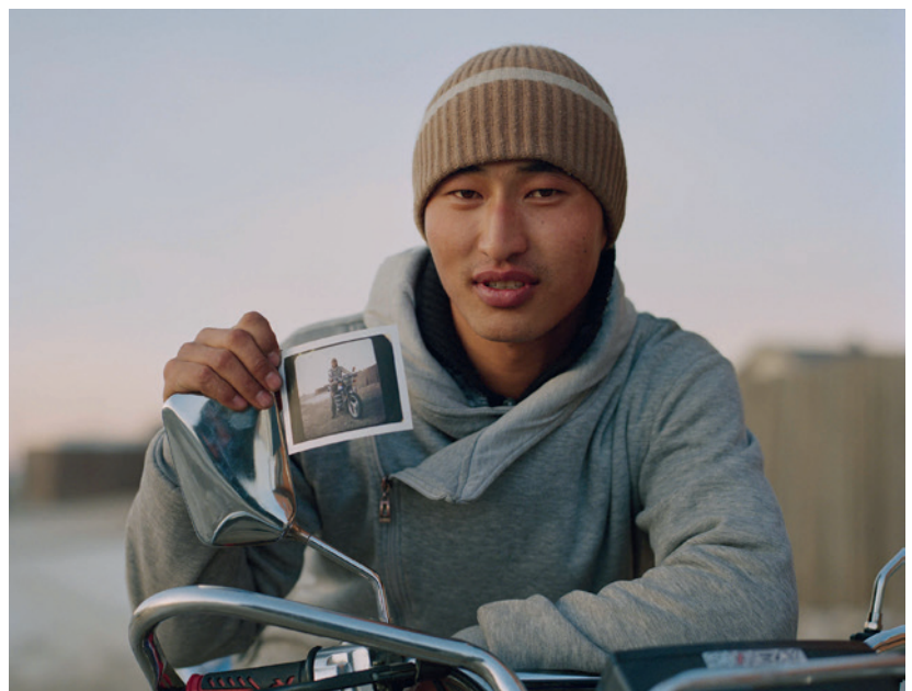
Mongolia, 2009