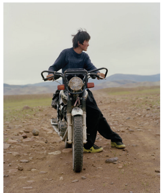
Mongolia 2009 © Simon Schwyzer