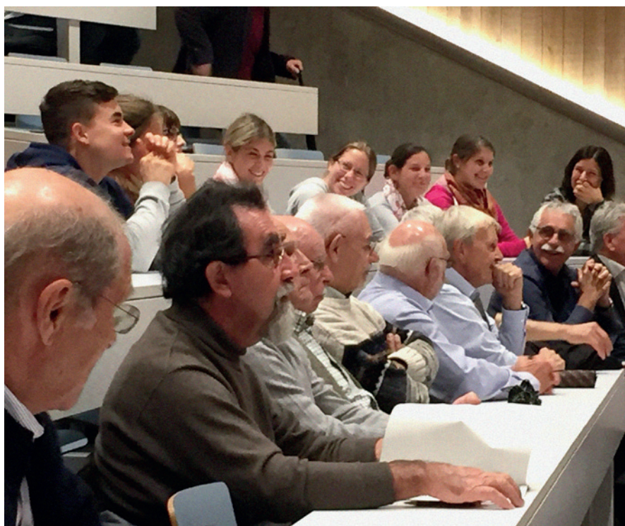
Jungmitglieder und ältere Alumni-Mitglieder trafen sich im KDHS zur Mitgliederversammlung

Mit diesem Zitat aus der Zielsetzung der Alumni-Organisation der Vetsuisse-Fakultät Universität Zürich als Einstieg möchten wir Jungmitglieder gerne unsere Eindrücke