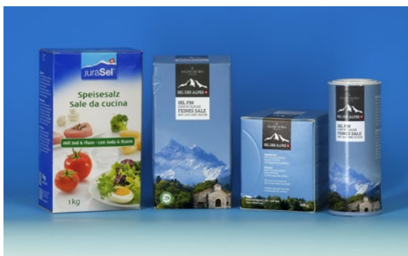
Sel de cuisine iodé et fluoré.

En Suisse et depuis 1983, le sel de cuisine iodé et fluoré est disponible pour la prévention de la carie (p. e. JuraSel en paquet à bande verte contenant 0,025 % de fluorures). L'usage quotidien de dentifrices fluorés compte également dans la prévention de base de la carie.