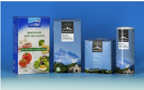
Fluoridiertes und jodiertes Speisesalz.

Geringe Mengen von Fluorid sind im Trinkwasser und in Lebensmitteln vorhanden. Die Fluoridkonzentrationen sind aber im allgemeinen sehr niedrig, so dass keine kariesvorbeugende Wirkung auftreten kann. Für einen wirksamen Kariesschutz steht in der Schweiz seit 1983 das jodierte und fluoridierte Speisesalz zur Verfügung (z. B. JuraSel im Paket mit grünem Streifen, das 0,025 % Fluorid enthält). Zur Grundvorbeugung gehört auch die tägliche Benützung von fluoridhaltiger Zahnpaste.